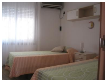
Dues imatges de les instal·lacions del pis d'acollida Reina Elisenda de Montcada – Clos de Sant Francesc