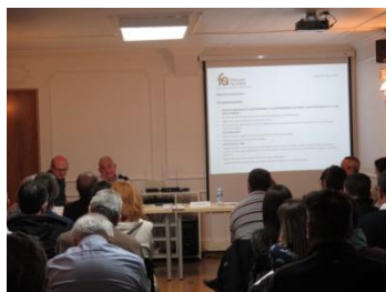
Una imatge de l'Assemblea

L'Assemblea General de Socis es va celebrar el 9 de març a la seu social de l'Associació. En ella es va informar entre altres temes de les línies d'actuació del 2019 i l'estat dels comptes.