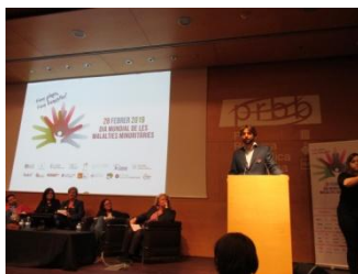
Una foto de la Jornada

afectats per una malaltia minoritària a Catalunya, per tal que es pugui fer front amb èxit els reptes addicionals del seu dia a dia.